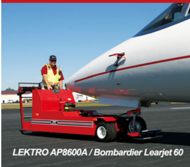
LEKTRO AP8600A / Bombardier Learjet 60