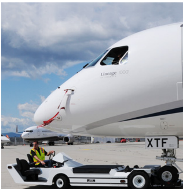
LEKTRO AP8850SDA / Embraer Lineage (EMB.195)